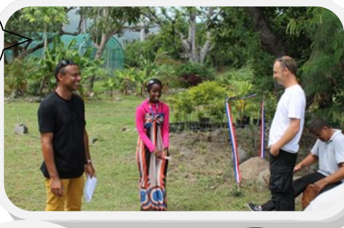
Inauguration de l'atelier Horticole